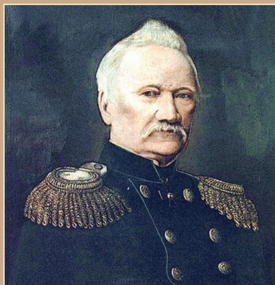
Неизвестный художник. Портрет И. П. Чайковского. XVIII век.

В 1908 - 1911 годов завод подвергся коренной реконструкции. Вместо старой домны объемом в 45 кубических метров возведена мощная доменная печь новой конструкции объемом в 185 кубических метров с суточной производительностью в 5,5 тыс. пуд (90 т), которая была пущена в 1912 г. Одновременно с новой доменной печью, выстроена мартеновская печь суточной производительностью в 40 т. Мощность прокатных кровельных станов была доведена до 1,2 млн. пуд (20 тыс. тонн) кровельного железа в год. В 1913 г. завод выплавил 538,6 тыс. пуд чугуна, в 1914 г. – 1289,1 тыс. пуд. Было произведено мартеновских