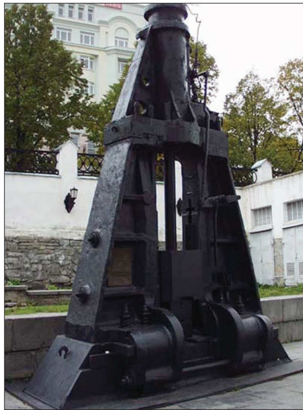
■ Паровоздушной молот XIX века (Музей истории архитектуры и промышленной техники Урала)

В начале XIX века производительность оставалась на прежнем уровне. Открытие нового Нейво-Алапаевского завода привело к закрытию ряда предприятий Яковлевых. Верхнесинячихинский завод был остановлен на 24 года.